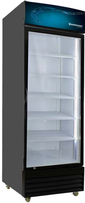
WPSN-45D21.FT Net cap. : 411L - 15cu ft